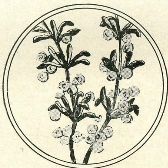
৩নং চিত্র—ডিমশুদ্ধ ঝাঁঝি

প্রজননের পর পুরুষ ও স্ত্রী মাছ প্রজনন হাপা বা চৌবাচ্চা থেকে সরিয়ে নেওয়া হয়। ঝাঁঝিতে লেগে থাকা নিষিক্ত ডিম ফোটারোর জন্য ডিম ফোটারোর হাপাতে স্থানান্তরিত করা হয়। প্রজনন হাপাতে কিছু নিষিক্ত আলাগা ডিমও পাওয়া যায়, সেগুলিকেও ডিম ফোটারোর হাপাতে স্থানান্তরিত করা হয়। একটি ৬ ফুট X ৩ ফুট X ৩ ফুট আকারের ডিম ফোটারোর